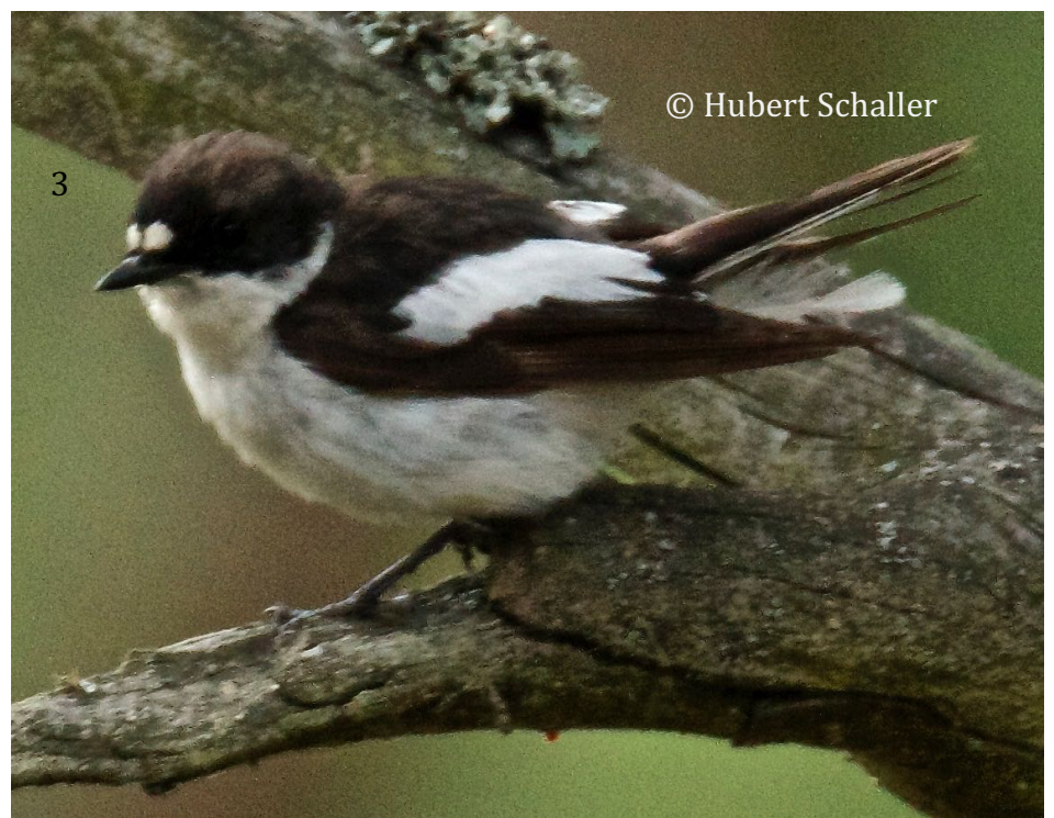
Abb. 3: ♂ fütternd. 03.07.

Abb. 2: ♂ Im Brutkleid. 01.07. Bei älteren Männchen können die Augenflecken zusammenfließen wie bei ssp. iberiae .