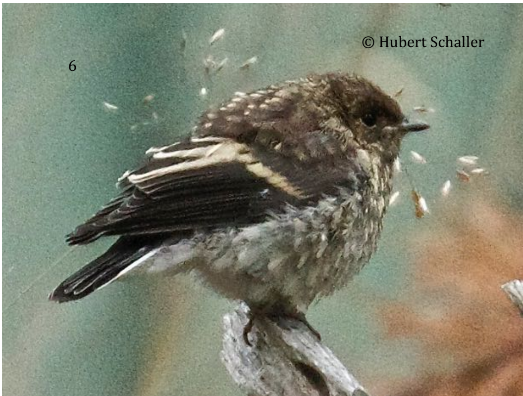
Abb. 6: Läufing, er wird noch am Boden gefüttert. 03.07.