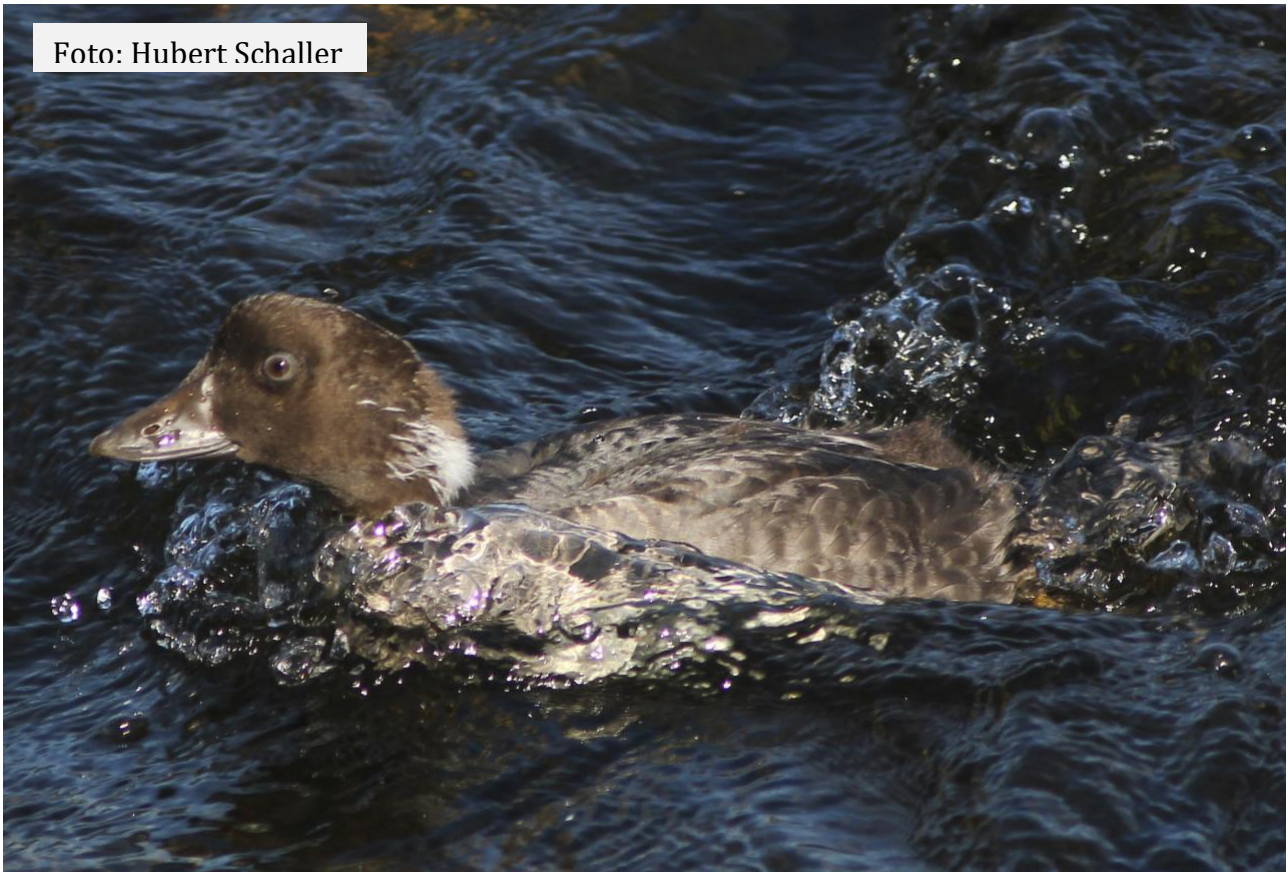
Diesjährige juvenile Schellente im hochnordischen Brutgebiet. 25. 07.