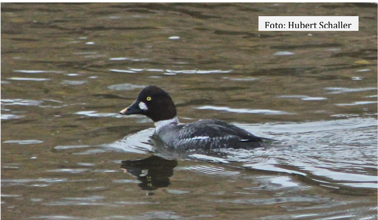
Adulter Schellenten-Erpel im Brutkleid. 17.02.