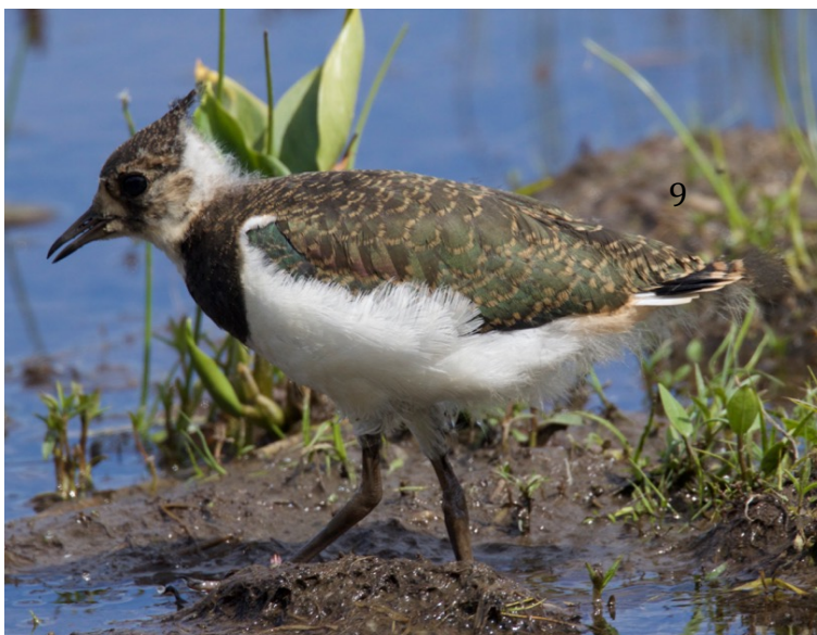
Abb. 5: Kiebitze im Schlichtkleid. Beide Geschlechter weiße Kehle mit kurzer Holle. ♀ mit 4, ♂ mit 3 weißen Handschwingspitzen. 03.09.