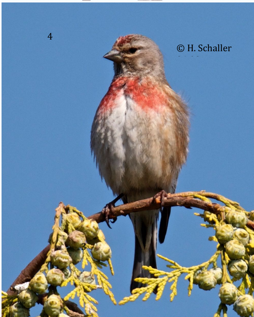
Abb. 4. Bluthänfling♂ im vollen Brutkleid während der Erstbrut. 02.06.