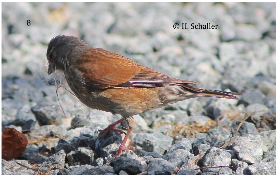
Abb. 8: Bluthänfling ♀ im Brutkleid. Es sammelt Nistmaterial für das Nest der Zweitbrut. 23.07.

Abb. 7: Bluthänfling ♀. Es hat während der Erstbrut kurzfristig das Nest verlassen, um den Brutfleck zu putzen. 04.06.