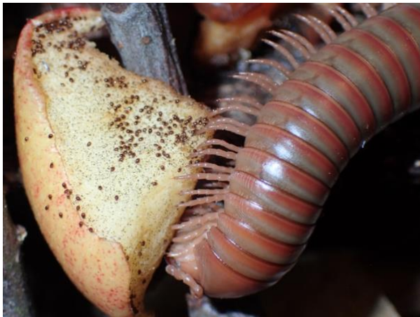
Neben diesem Tausendfüßer sind Hornmilben Winzlinge

In Wäldern der gemäßigten Breiten können auf einem Quadratmeter Boden bis zu 200.000 Horn- oder Panzermilben leben. Sie gehören damit zu den individuenreichsten Bewohnern der oberen Bodenschichten, wo sie sich überwiegend von verrottendem Pflanzenmaterial ernähren. Wie Asseln, Tausendfüßer, Springschwänze und Fadenwürmer sind Hornmilben als Zersetzer (Destruenten) wichtige Stationen im Nährstoffkreislauf und tragen damit zur Humusbildung bei. Weltweit sind etwa 11.000 Hornmilbenarten beschrieben, in Deutschland sind es 400. Die tatsächliche Artenzahl liegt sicher viel höher. Um diese Unbekannte zu erfassen und mehr über die ökologische Rolle dieser winzigen Organismen zu erfahren, werden in der Bodenbiologie zunehmend Genomanalysen eingesetzt.