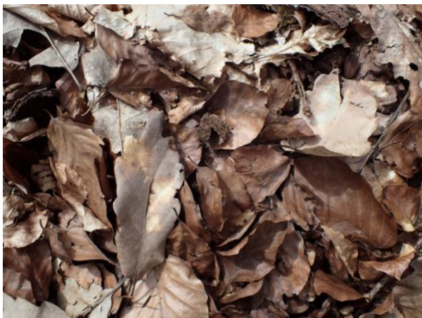
Fast unversehrt: die obere Falllaubauflage