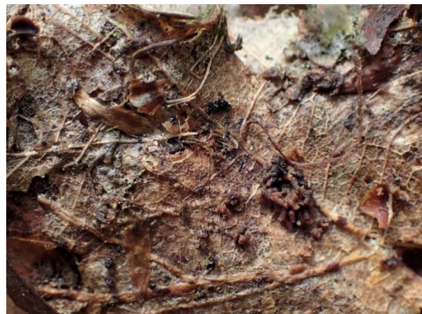
Darunter: das Werk von Hornmilben & Co. - deutlich sichtbar