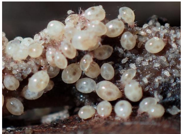
Eine ungepanzerte, weiße Hornmilbenart mit vielen Jungen