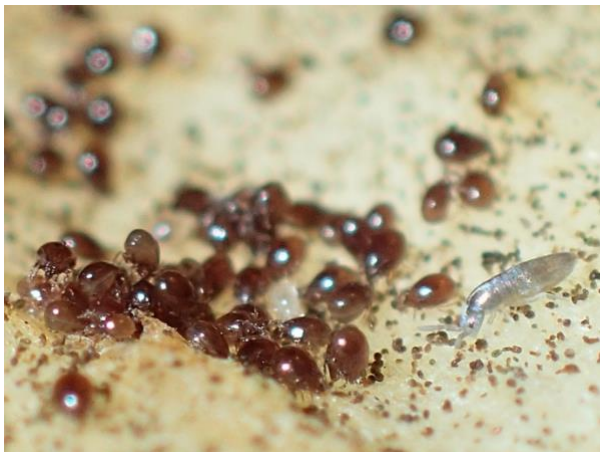
Der silbrige Springschwanz rechts misst auch nur 2 mm...